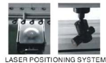
LASER POSITIONING SYSTEM